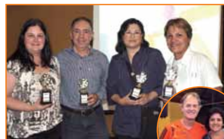
Os cinco primeiros classificados do Torneio de Tranca.