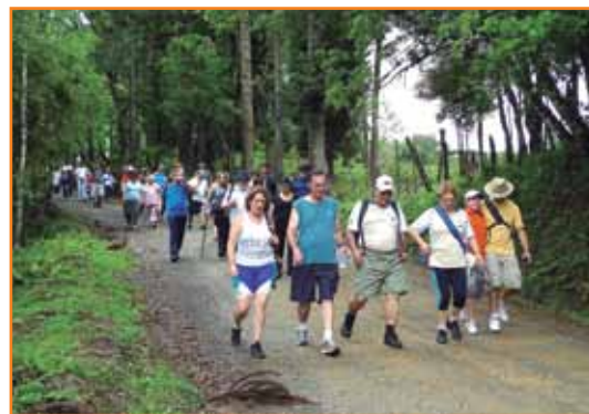
Caminhadores passam por trechos florestais.

O ponto de chegada da caminhada também foi a Chácara Rancho Alegre. De lá, eles embarcaram para Curitiba, onde a maioria ficou entusiasmada para saber quando será a próxima caminhada. A previsão é que ela ocorra em março de 2013, com destino ainda a ser definido. A primeira caminhada foi realizada em São Luiz de Purunã, a cerca de 50 km da capital.