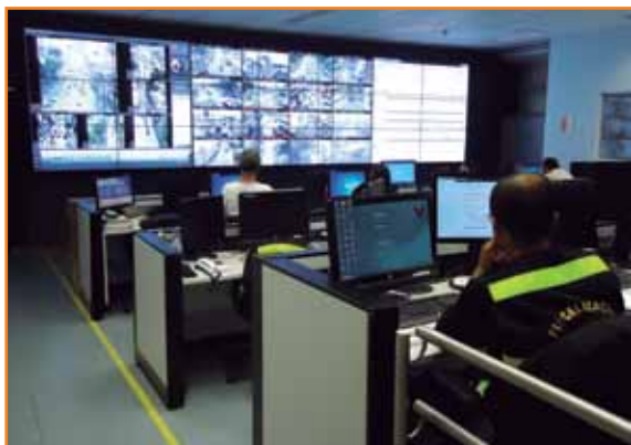
Centro de controle operacional do SIM.

Os investimentos iniciais contratados pela Caixa somam aproximadamente R$ 464 milhões (R$ 440 milhões do FGTS), dos quais foram desembolsados cerca de R$ 27 milhões.