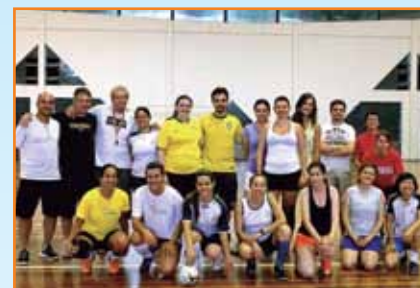
Atletas e coordenadores em avaliação na sede social.

Na capital, atletas são avaliadas para formação de equipe de futsal feminino