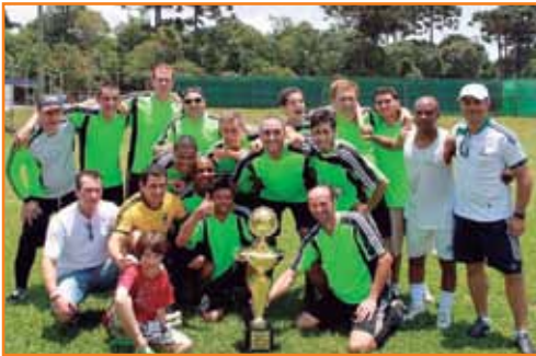
A comemoração dos campeões do soçaite livre.

Após empate, times do Soçaite Livre, do Futsal 50+ e do Interagências decidem título em tempo extra