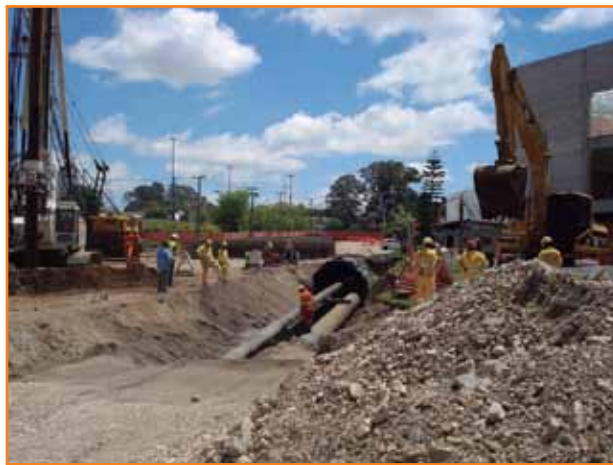
Viaduto Francisco H. dos Santos: requalificação do corredor aeroporto/rodoferroviária.

Entre os principais empreendimentos da mobilidade urbana financiados pela Caixa em Curitiba e região metropolitana, destacam-se: a requalificação do Corredor Aeroporto/Rodoferroviária, a requalificação do Corredor Marechal Floriano, o Sistema Integrado de Monitoramento (SIM), a requalificação da Rodoferroviária e seus acessos, a reforma e ampliação do Terminal Santa Cândida e as Vias de Integração Radial Metropolitanas.