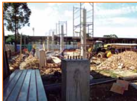
Requalificação da rodoviária.