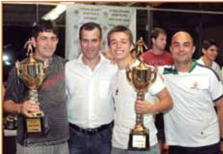
Primeiros colocados da série prata do Futsal Livre.