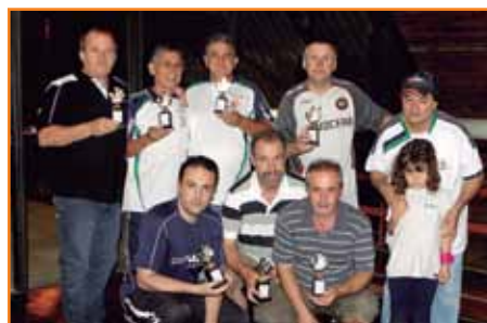
Os primeiros colocados no torneio de truco deste ano.