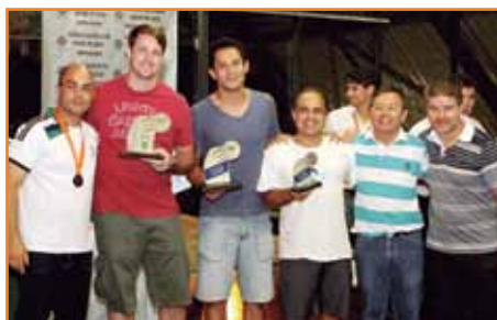
Integrantes da equipe de vôlei masculino: boa atuação em 2012.