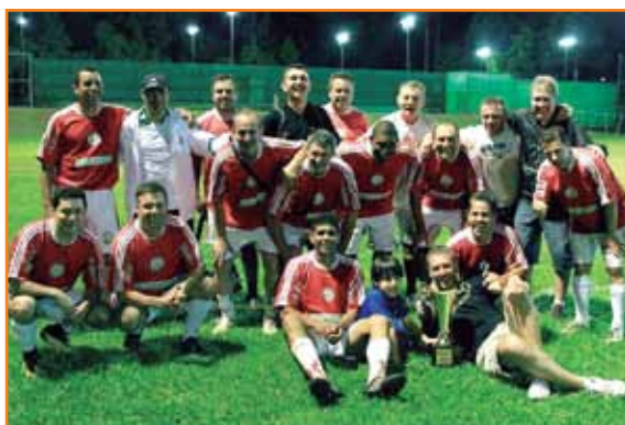
Jogadores do Choop Bol comemoram o título.

Em jogo disputado, esse é o segundo título conquistado durante o ano