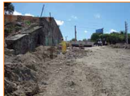
Trincheira do Guabirota: obras do corredor aeroporto/rodoferroviária.