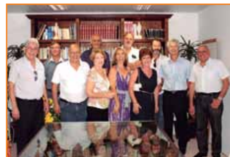
Membros titulares do Conselho Deliberativo.