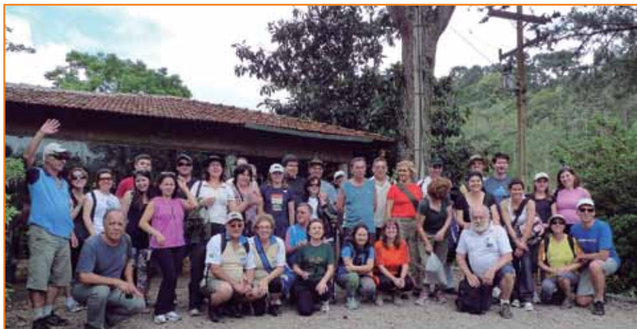
Grupo participante do roteiro em Quatro Barras: integração e valorização do bem-estar.

No caminho, os participantes também tiveram a oportunidade de conhecer trechos utilizados pelos religiosos e os pri-