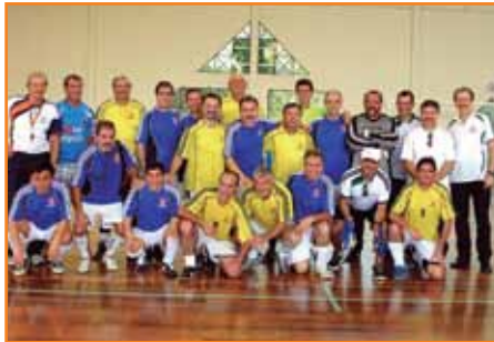
Futsal 50+: times do Pato Branco e do Cambé.