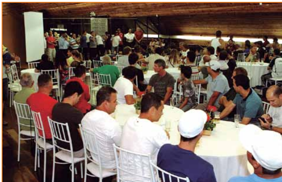
Evento reúne atletas, coordenadores, diretores e convidados.