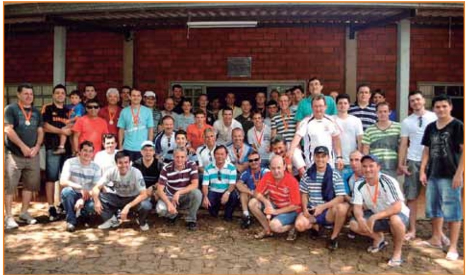
Atletas e dirigentes que participaram da competição em Francisco Beltrão.