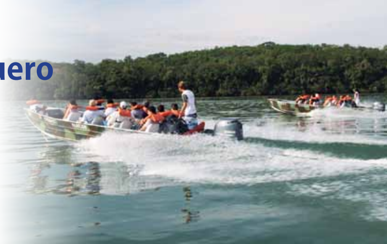
Em Porto Rico, passeios de barco são dicas para aproveitar a cidade.

Para quem prefere o litoral nessas férias, a associação oferece a Sede de Praia, localizada no balneário Caiobá, uma das praias mais frequentadas do estado na temporada. Com uma infraestrutura de lazer e comodidade, a sede tem 2.700 m 2 e contempla 16 apartamentos simples para duas pessoas, 32 apartamentos duplos com capacidade para cinco pessoas, piscinas, quadras esportivas (futebol de campo, futebol de areia e vôlei), camping e restaurante.