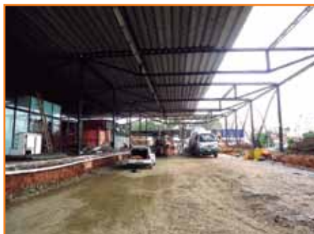
Reforma e ampliação do terminal Santa Cândida.