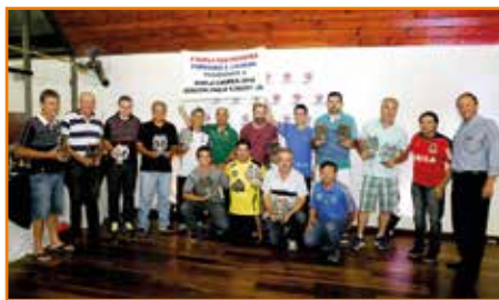
Comemoração dos 10 primeiros do truco, com direito a faixa.