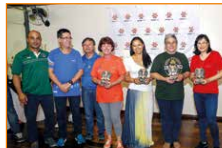
Premiação dos primeiros colocados na tranca.