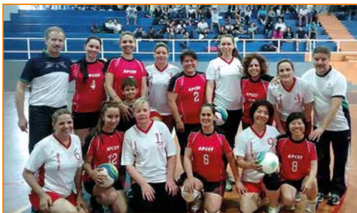
...londrinenses e maringáenses do vôlei preparam-se para o jogo.

Confira o resultado completo das modalidades realizadas nas duas sedes no site da APCEF-PR ( www.apcefpr.org.br )