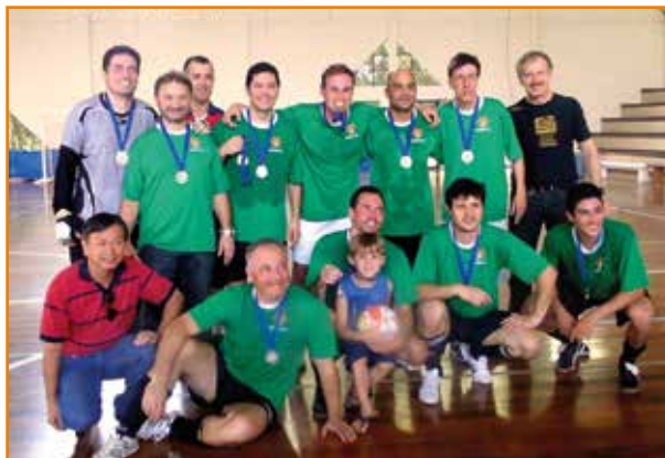
Time campeão: marcação firme e contra-ataques certos.