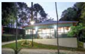
Espaço Gourmet3: novo espaço para confraternização.