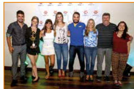
Coordenadora do futsal feminino e atletas também do masculino.