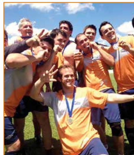
Em Pato Branco, time campeão de Francisco Beltrão.