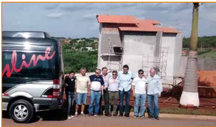
Diretores e arquiteto em frente à edificação de Alvorada do Sul.

A construção da sede contempla dois sobrados geminados, com sala e cozinha conjugadas, quarto, banheiro e garagem, além de área social (banheiros, churrasqueiras, cozinha e área de alimentação). A previsão é que a nova edificação fique pronta em fevereiro.