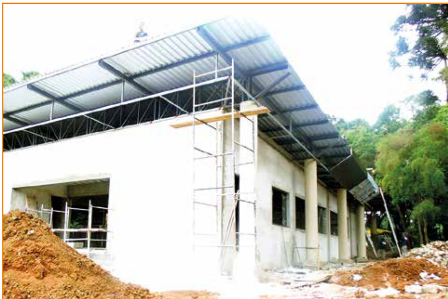
Construção da academia na sede social: estrutura quase pronta.

Em Curitiba, a construção da academia avança a cada dia e a previsão é que seja concluída até fevereiro. A estrutura principal está praticamente pronta, faltando ajustes como pintura interna e