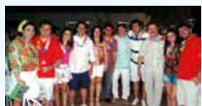
...dirigentes e sócios reunidos no evento londrinense.