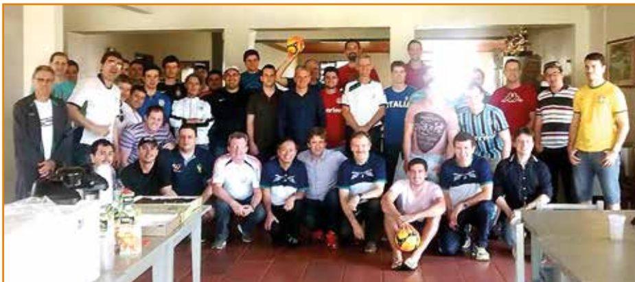
Atletas e dirigentes reunidos nos Jogos do Oeste, Sudoeste e Campos Gerais.

Depois, foi a vez da Regional Londrina receber mais uma edição dos Jogos do Norte e Noroeste. No dia 22 de novembro,