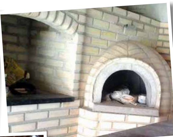
Jacarezinho: churrasqueira (ao lado) e cozinha em fase de acabamento.