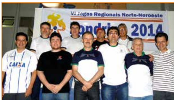
Gestores da Caixa, da APCEF e da AEA nos Jogos em Londrina...

tados, futsal masculino e feminino, buraco, tranca, truco, pôquer, cahetão, caqueta dura, dominó, damas, xadrez e tênis de mesa masculino.