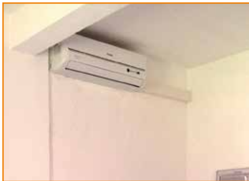
Ar condicionado instalado: todos os quartos receberam um.

externa, revestimento de cerâmica, colocação de forro e instalações elétricas. A edificação também tem uma boa área envidraçada e ganhará deck na frente com vista para a piscina, onde os frequentadores do local poderão descansar.