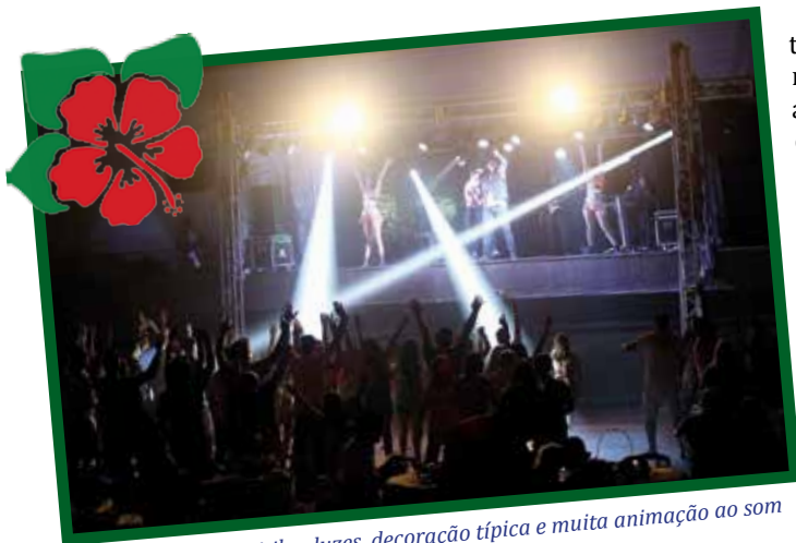
Festividade em Curitiba: luzes, decoração típica e muita animação ao som da banda Memories.

Com programação própria, eventos agitam associados da capital e de Londrina