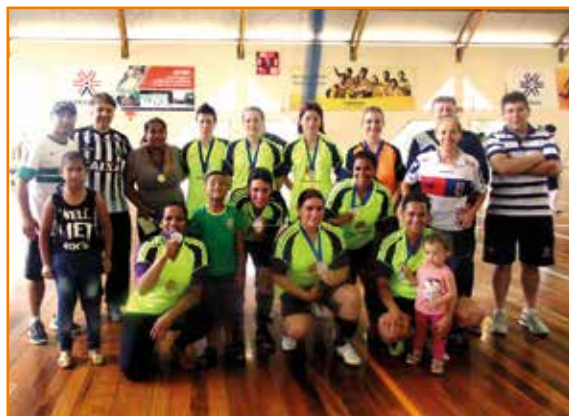
Equipe campeã de Campina: experiência em jogar juntas.

Campeonato criado pela APCEF é o primeiro realizado para as mulheres