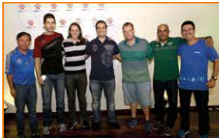
Coordenador, técnico, atleta do basquete com dirigentes.