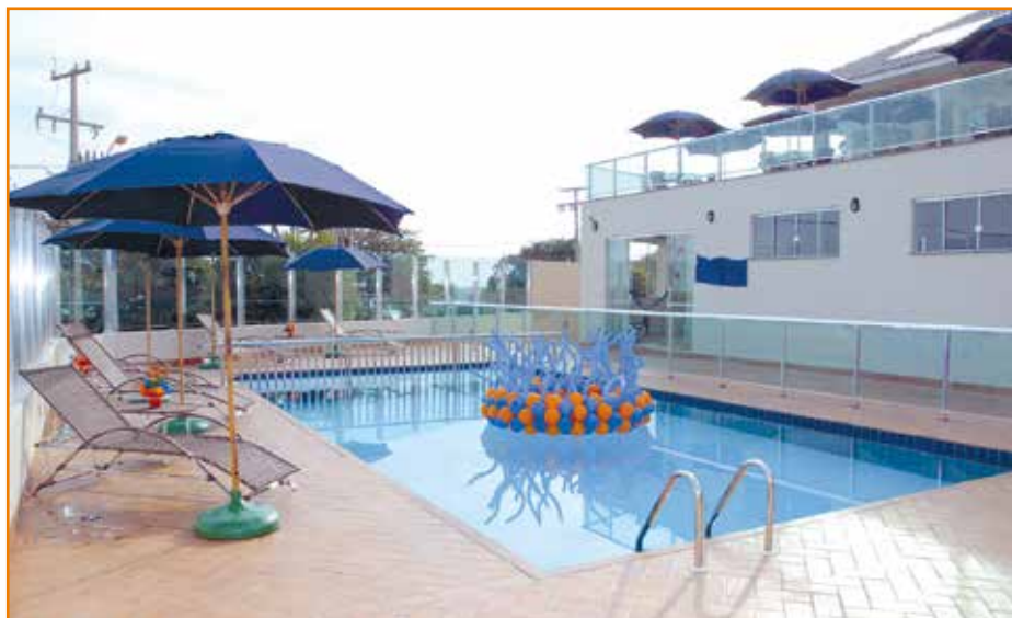
Sede de Porto Rico: piscina e vista privilegiada do Rio Paraná.

Sedes de praia, pesca e até de campo a preços acessíveis divertem os associados no Paraná e em outros estados