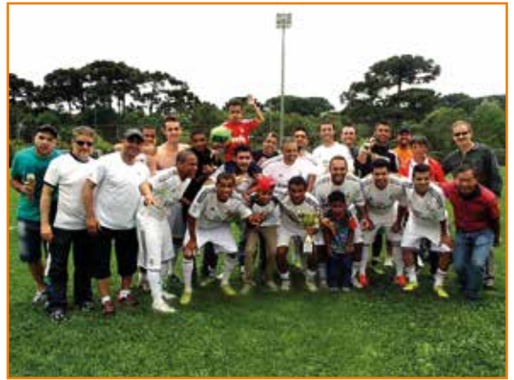
Comemoração em dose dupla com amigos e dirigentes.