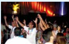
Animação total na festividade da capital...

O agito do Baile do Havai em Curitiba e Londrina