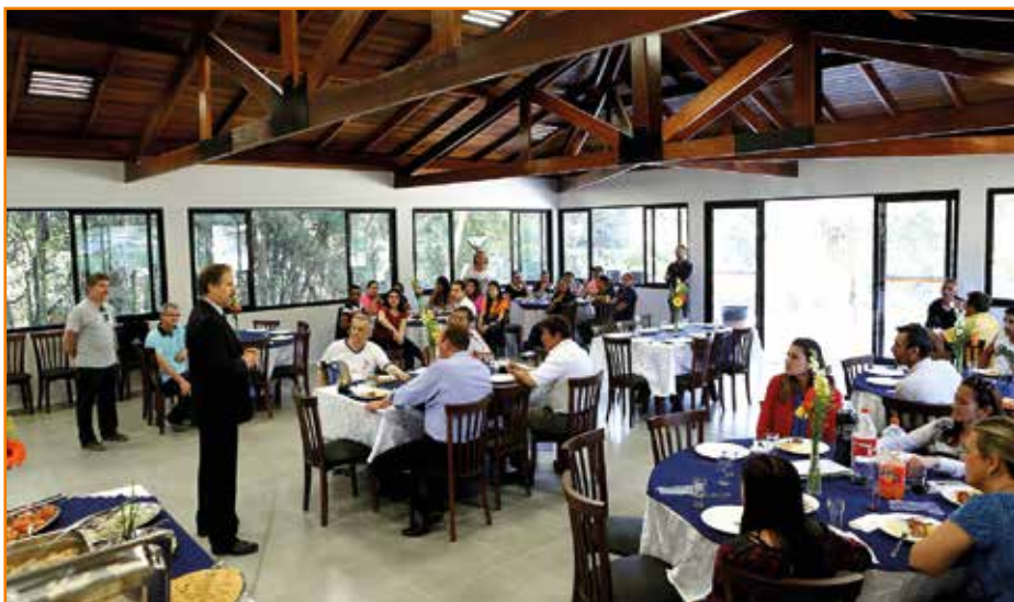
Espaço Gourmet 3: primeiro almoço com funcionários realizado após a construção.

O ano de 2014 teve diversas benfeitorias e acontecimentos importantes. Confira os principais deles: