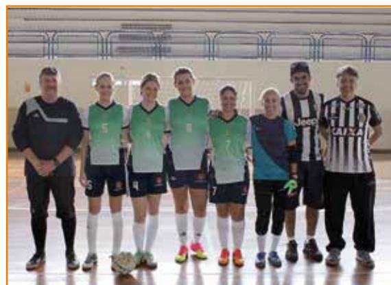
Jogadoras do time da APCEF, anfitriãs da competição.