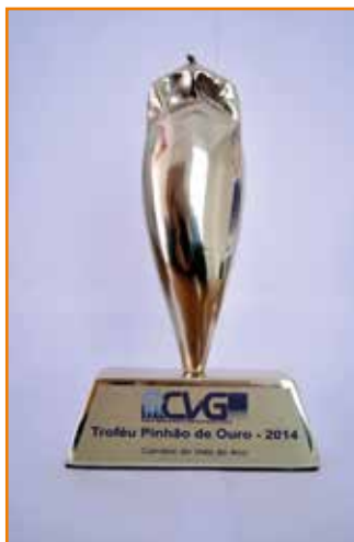
Prêmio recebido na categoria corretor de vida do ano.

Eckhardt - Falar sobre esta parceria e histórico é fácil, porém, resumo dizendo que a APCEF-PR é nossa parceira desde nossa fundação. Isso diz tudo!