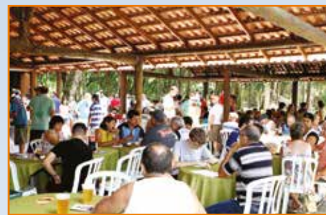
Almoço em comemoração aos aposentados de 2013.

Para homenagear os aposentados, a APCEF-PR programa mais um almoço especial na sede social, em parceria com a AEA. Com o apoio da FENAE, o evento está previsto para ocorrer em 24 de janeiro, data de comemoração do Dia do Aposentado. Em breve, mais detalhes sobre a programação, no site e informativo da associação.