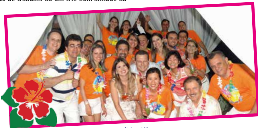
Grupo animado de associados londrinenses e dirigentes.