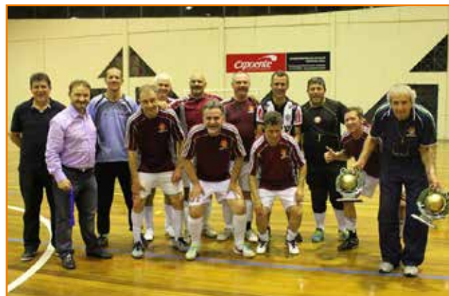
Equipe campeã festeja premiação com dirigentes e coordenador.