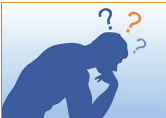
Pela nova regra, o valor a ser equacionado é R$ 1,9 bilhão.

Os participantes da Funcef, pessoal da ativa e aposentados, aguardam a decisão da entidade em optar pela regra vigen-