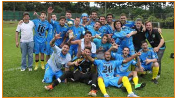
Centauro comemora título, após tentativas anteriores de conquistar a taça.

Para Colbert, o grande diferencial da equipe foi a união entre os atletas. “Temos o grupo mais homogêneo da APCEF. Qualquer um dos 20 jogadores pode receber convite de outras equipes, mas não sai.”. O técnico afirma que a sensação de ser campeão é de muita alegria e, ao mesmo tempo, de alívio após tanto tempo buscando a taça. “Nossa equipe é muito respeitada, mas faltava a taça. Vínhamos de alguns resultados negativos, como a final de 2013 em que estávamos com o jogo ganho e fomos derrotados no fim. Então, tínhamos uma pressão normal”, explicou ele.