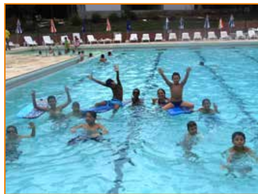
... e disputa com pranchas para os maiores.

e a madrugada se divertindo, é R$ 50,00 para sócio e R$ 70,00 para convidado. Inscrições pelo telefone (41) 3083-1001 e e-mail secretaria@apcefpr.org.br