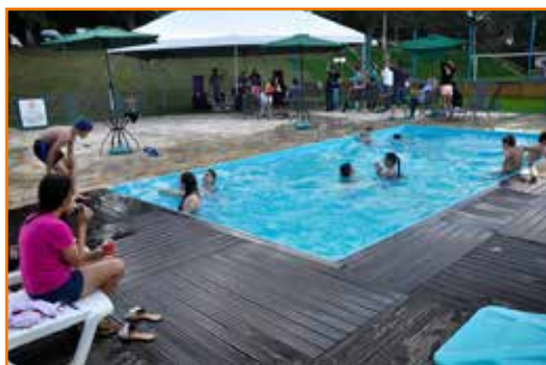
Crianças se refrescam na piscina, enquanto banda toca.

Em Ponta Grossa, a regional decidiu reunir toda a família de associados, especialmente da região, para festejar o término de 2015. Cerca de 200 pessoas passaram pela sede no dia 12 de novembro e participaram do APCEF Experience, cuja organização teve a participação de pelo menos 50 pessoas.