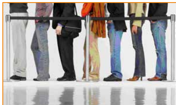
Em agências, falta mão de obra e sobram filas para atendimento.

Em 2014, a Caixa realizou um dos maiores concursos públicos da história. Na ocasião, a organização registrou quase 1,2 milhão de inscritos, dos quais 32.879 foram aprovados. Até o momento, apenas 3.182 foram convocados (9,67% do total) e apenas 2.482 admitidos (7,54% do total). Neste ano não houve nenhuma convocação que se tenha notícias.