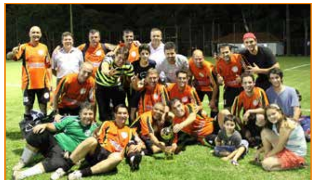
Time sagra-se campeão, depois de disputar partidas como se fossem a decisão.

coisas começaram a dar certo desde o início, com o convite de atletas que vestiram a camisa do Chopp Boll e jogaram todas as partidas como se fossem uma decisão”.