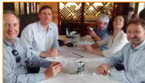
Representantes da APCEF-PR e da SPVS durante almoço para assinatura do convênio.

Além dessa medida, o convênio contempla incentivo à APCEF-PR e outras organizações a fazer parte do Programa Condomínio da Biodiversidade (Conbio), que busca orientar na conservação da biodiversidade e reverter processos de degradação ambiental nas áreas remanescentes de vegeta-