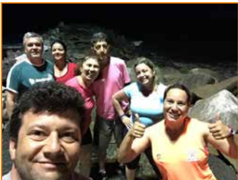
... à noite (segunda e quarta), a dica é o passeio pela orla.

Para as crianças (4 a 7 anos), tem muita diversão. Os pequenos poderão