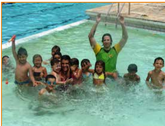
Diversão na piscina para os pequenos...

As atividades serão realizadas de segunda a sexta-feira, das 13h30 às 17h30. Para sócio, o valor da semana é R$ 150,00 e, para não sócio, R$ 200,00. Por dia, a diversão custa R$ 50,00, para sócio, e R$ 100,00, para convidado. O acantonamento, no qual a garotada passa a noite