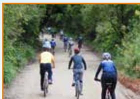
Desafios marcaram o 1º BikeCEF em Quatro Barras.