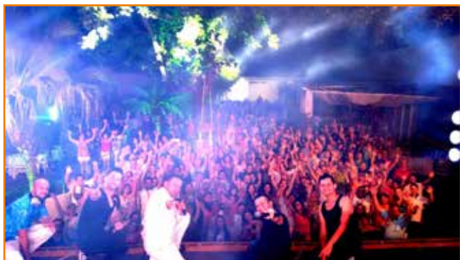
Iluminação especial reflete a alegria e a interação da banda com o público.

Baile do Havai em Londrina recebe incremento da organização e registra recorde de público