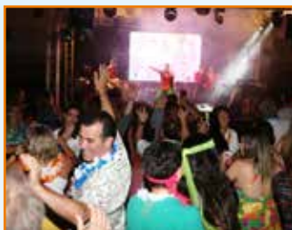
Até o Dinho do "Mamonas Assassinas" agitou o baile.

Baile do Havai reúne cerca de 500 pessoas