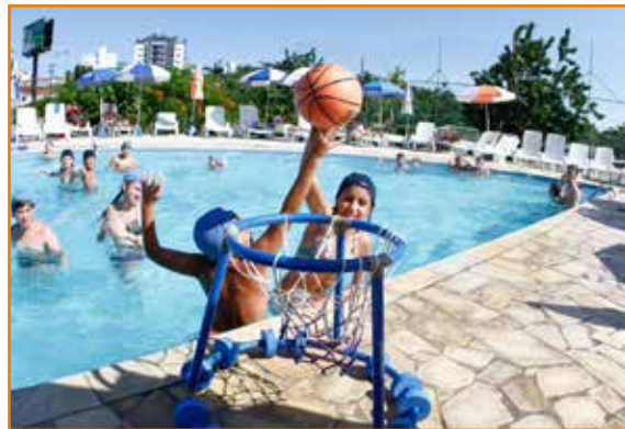
Durante o dia, a garotada se esbalda com o aquabasquete...

Para os adultos, a manhã começa com algumas atividades de integração e lazer. É o caso de betes de pais e filhos, boliche e chute a gol. Na sequência, vem a hidroginástica matinal, que agita o pessoal da piscina. À tarde, é a vez dos torneios esportivos, tênis de