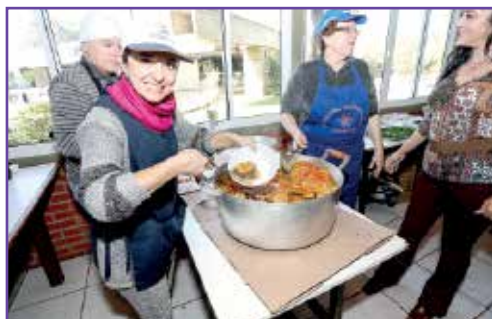
Moqueca estava entre os pratos oferecidos.

Para a sua 10ª edição, o Festival Gastronômico ganhará versão internacional. A proposta é preparar pratos típicos de vários países. A data está marcada para o dia 28 de julho.