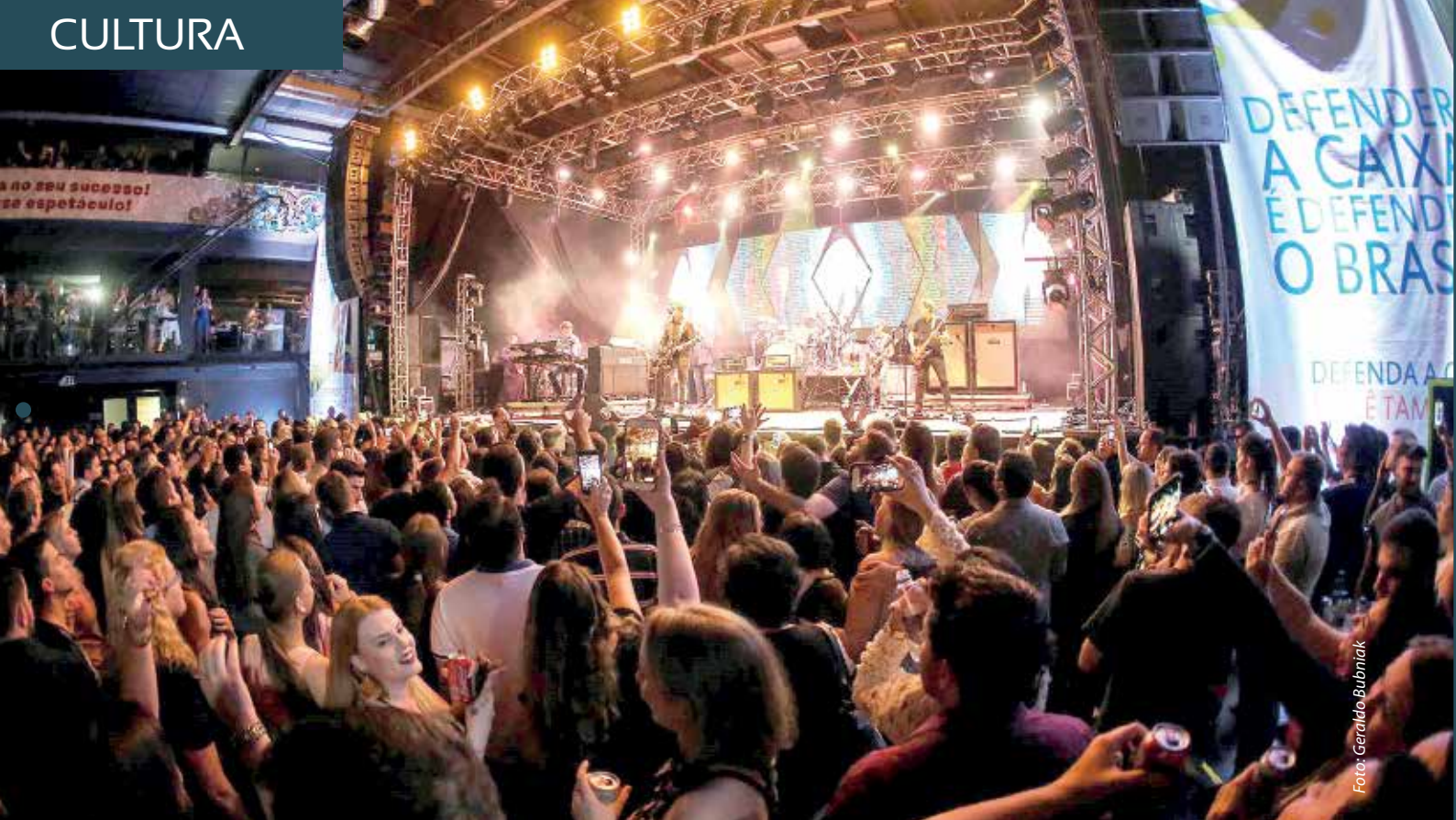
Show da Banda Skank agita público de quase 1.500 pessoas na Live Curitiba.