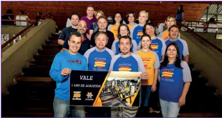
Entrega de premiação aos vencedores do programa.

Durante dois meses, 14 associados passaram por uma maratona de exercícios na academia da sede social e orientações para reeducação alimentar. Eles foram os pioneiros do programa "APCEF na medida", que iniciou em setembro e incentivou os participantes a perderem peso e ganharem qualidade de vida. "A maior satisfação foi escutar o relato de cada um e ver que conseguiram vencer a pior barreira, a psicológica, e atingir suas metas pessoais",