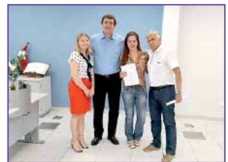
Filiação de nova sócia na agência de Foz.

Entre as ações divulgadas, estão estrutura organizacional da APCEF, atividades esportivas, so-