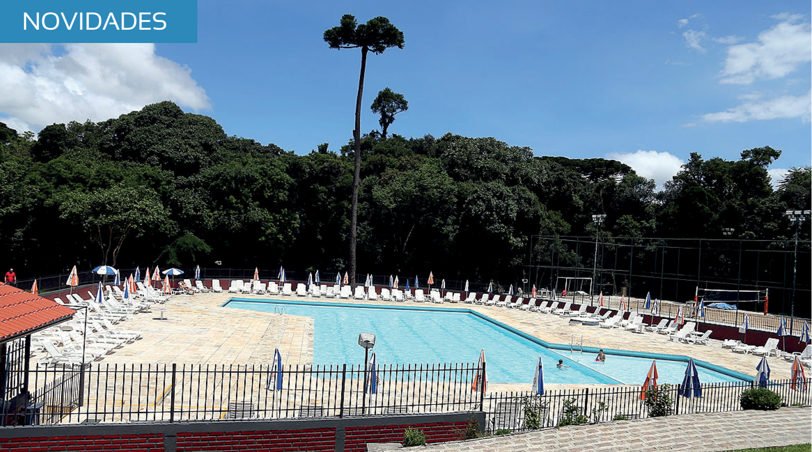
Na piscina da sede social, aulas de hidroginástica movimentarão os sócios a partir de janeiro.