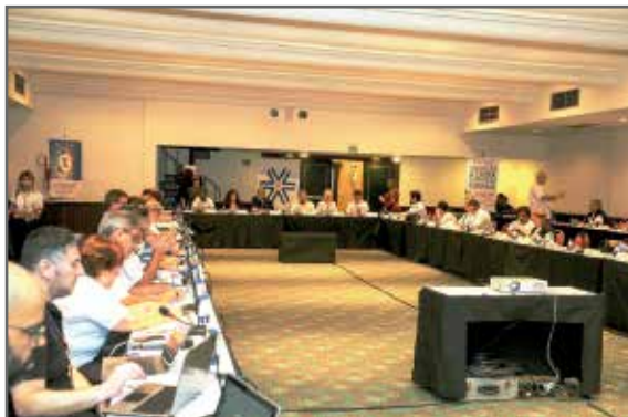
Diretores da Fenae e presidentes de APCEFs de todo o país decidem assuntos de interesse de associados.

Como uma das primeiras resoluções, os dirigentes aprovaram a participação no