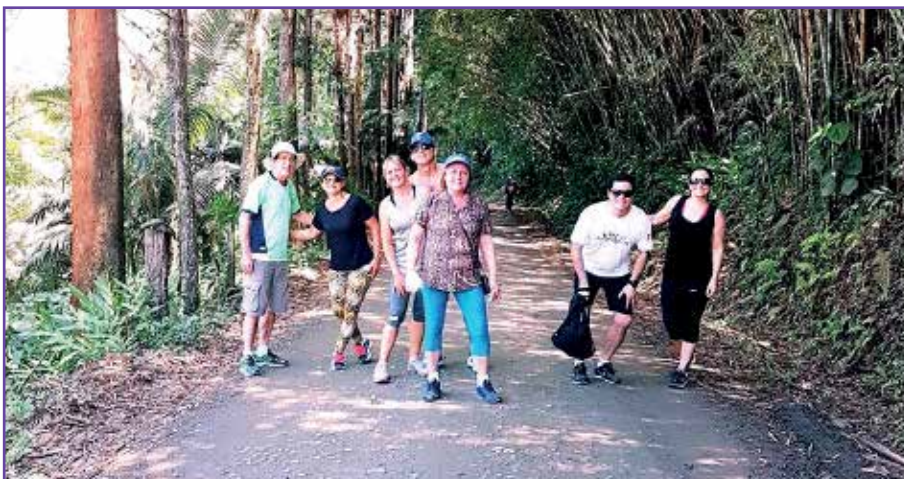
Caminhada passa por belas paisagens e integra participantes.