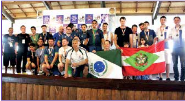
Equipe de vôlei masculino foi uma das que levou o ouro.

Com a conquista de 43 medalhas, a delegação do Paraná foi “trilegal” nos Jogos do Sul realizados em Bento Gonçalves (RS). Os atletas demonstraram preparo e dedicação e subiram ao pódio na maioria das modalidades disputadas. Entre os