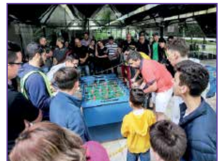
Torneio de pebolim atrai sócios em disputas empolgantes.

Os torneios de pebolim e sinuca voltam à programação do próximo ano. O de pebolim começa no mês de abril e o de sinuca em maio. As disputas de vôlei de areia iniciam já em fevereiro.