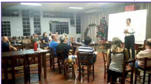
Apresentação sobre a APCEF-PR na sede de Toledo.

cioculturais e de lazer, convênios, Clube de Vantagens, seguro de vida, investimentos, sócio-família, site da APCEF, mobilização e desafios para conquista de novos sócios. Até o fechamento desta edição, os diretores somavam visitas a 16 coordenações, 25 agências, três SRs, oito novas filiações e ainda se preparavam para visitar mais três regionais (Ponta Grossa, Paranaguá e Guarapuava) e a SR Campos Gerais. ●