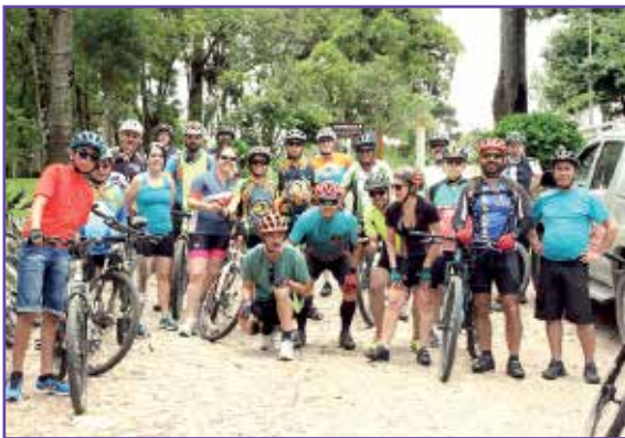
Ciclistas na vinícola Araucária, na Colônia Murici.

O visual parece de cinema: plantações que lembram tapetes, cascatas no meio da mata e muito verde. As paisagens, no entanto, são bem reais e serviram de cenário para a etapa Curitiba que completou o Circuito BikeCEF deste ano. No dia 25 de