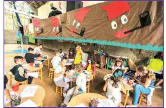
Saci inspira atividades para os pequenos.

no gramado, levaram seu lanche e aproveitaram as recreações do dia, como show de mágicas, piscina de bolinhas, cama elástica, badminton e slackline. Quem ficou com gosto de quero mais ou não pôde participar das atividades, teve a oportunidade de aproveitar um dia todo dedicado aos sócios mirins, em 22 de outubro. Começou com passeio ciclístico no Parque Náutico do Iguaçu, depois sorteio de brindes na sede social e Festa do Saci.