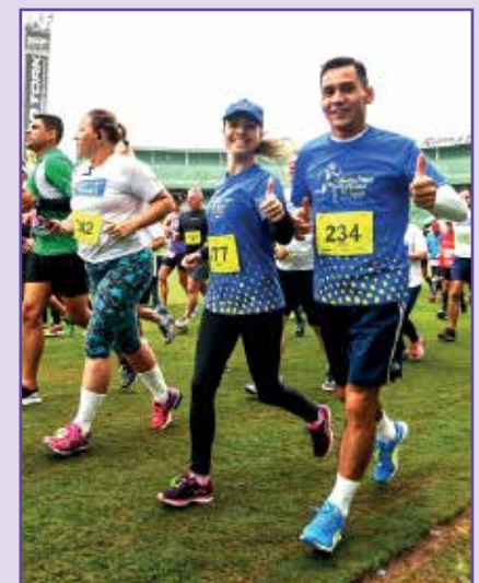
Athletas na Corrida do Pessoal da Caixa de 2017.

Para o próximo ano, estuda-se uma parceria com a UFPR, a fim de utilizar a nova pista de atletismo para os treinos. ●