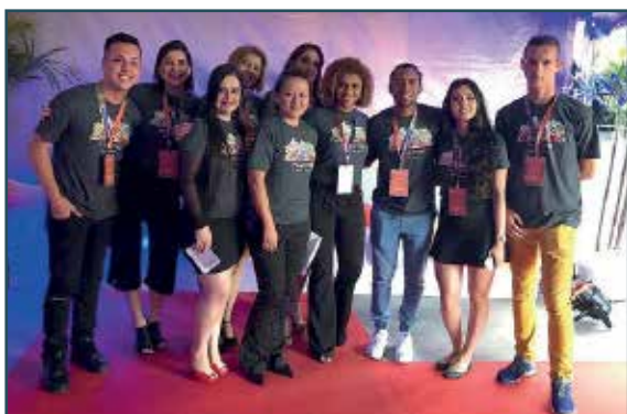
Parte da equipe de organização da APCEF-PR em parceria com a Fenae.

A grande final do Talentos Fenae/Apcef aconteceu de 5 a 8 de dezembro, mas o seu planejamento começou vários meses antes. Enquanto iniciavam as inscrições de obras de empregados da Caixa Econômica Federal em oito modalidades artísticas, Curitiba defendia sua candidatura como sede do evento na reunião do Conselho Deliberati-