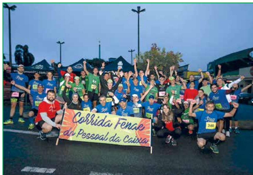
Grupo reunido antes da largada: grande participação e integração.