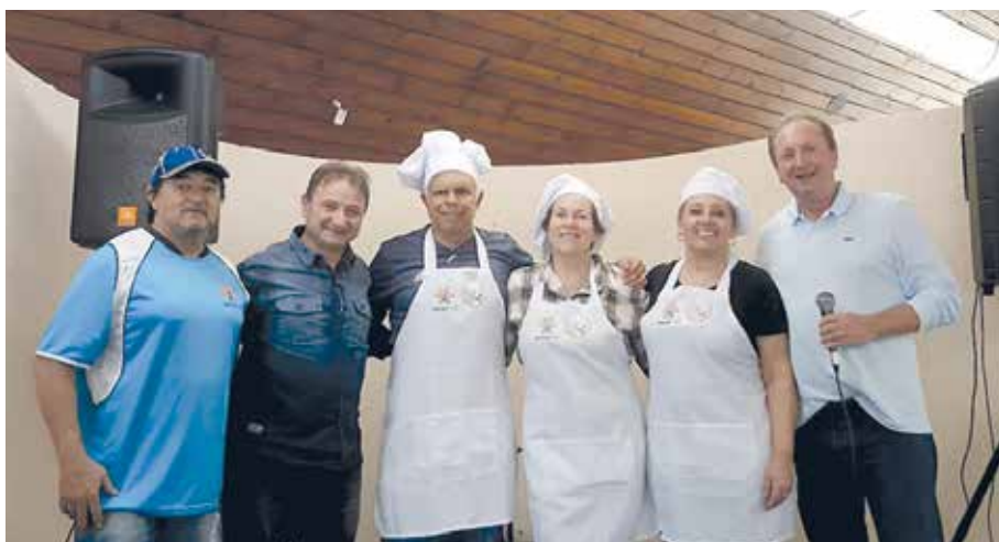
Chefs do mês de junho ganham avental e certificado do evento.

Cozinhar em casa e agregar a família em volta do fogão voltaram a fazer parte da programação de muitos lares, especialmente no domingo. Em sua terceira edição, o Seja Chef por um dia traz um pouco desse momento gostoso em família e, também, entre amigos para a cozinha da APCEF-PR.