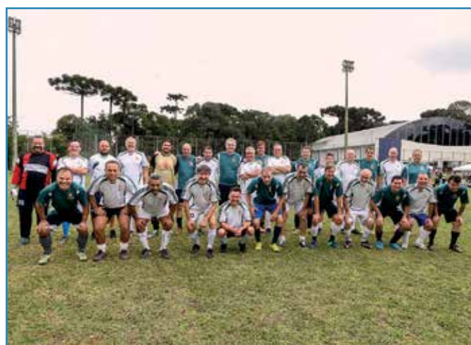
Atletas de soçaite das duas SRs se enfrentam: clima é amistoso.

No encerramento, atletas e convidados participaram de um almoço, com costela fogo de chão e sorteio de brindes. A medalha oferecida nas premiações teve o formato do mapa de Curitiba, com os bairros que correspondem às superintendências destacados em azul.