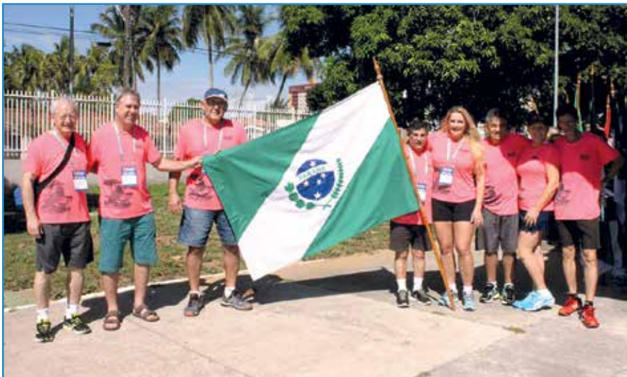
Delegação paranaense com representantes de vários esportes disputados.

AEA-PR fica a duas medalhas do título de nº 1 da competição