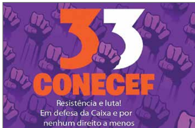
Conecef: o principal tema foi a defesa da Caixa como um banco totalmente público.

Sobre a questão do contencioso, Esteche afirma que essa deve ter o envolvimento de todos os empregados participantes