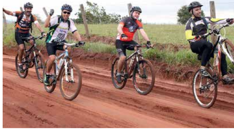
Nos trajetos, um pouco de lama aumenta o desafio dos bikers.

O percurso – Em sua segunda etapa (a primeira foi em Londrina), o Circuito BikeCEF reuniu 61 associados que participaram da aventura em duas categorias: a light, de 32 km, e a normal de 65 km. No itinerário, uma das paradas do percurso ocorreu na cidade de São Pedro do Paraná, com o encerramento das trilhas acontecendo no Porto São José. Ali, os participantes tiveram a chance de realizar um passeio de draga até Porto Rico.