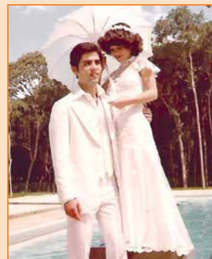
No dia do casamento, noivos curtem a APCEF-PR.