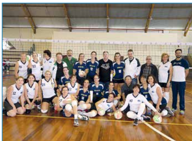
Competidoras de vôlei feminino reunidas: espírito desportivo.