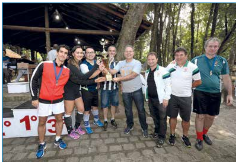
Representantes de diversas modalidades da SR Curitiba Leste comemoram título.