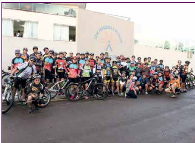
Grupo reunido em frente à sede da APCEF-PR: ponto de partida.

O secretário de Turismo ainda convida todos os associados que ainda não conhecem Porto Rico e a sede pesqueira a fazerem uma visita. “Nossa cidade oferece paisagens muito bonitas, principalmente à margem do rio Paraná: a Praia de Santa Rosa, as demais prainhas, os passeios de barco... Costumamos receber turistas da região e do Mato Grosso do Sul, mas queremos também que o pessoal de outras regiões venha.”