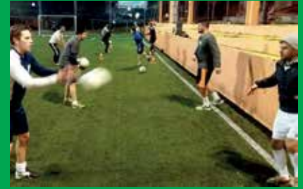
Treinos realizados na sede da Cof Sports.

Para quem não gosta das aulas repetitivas das academias, o Crossfut é uma opção para manter a forma e queimar calorias em atividades que alternam exercícios funcionais de força e treinos de futebol. As aulas podem ser realizadas ao ar livre, como parques e praças, ou em estúdios.