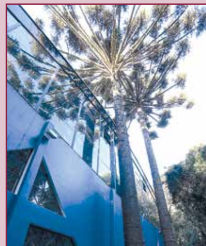
Pinheiro antigo da APCEF (o da frente), com cerca de 100 anos.

Quem anda pela sede social, nesta época, encontra facilmente pinhões pelo chão e alguns sócios levam para casa. Dos cerca de 300 pinheiros, 140 estão produzindo pinhas e, assim, deliciosas sementes.