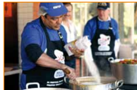
“Mestres-cucas” prepararam a moqueca em 2011.

Data: 21 de julho, a partir das 12h Local: sede social da APCEF-PR Valor: R$ 20,00 cada prato (individual), com acompanhamento Contato: (41) 3083-1001 (reservas antecipadas)