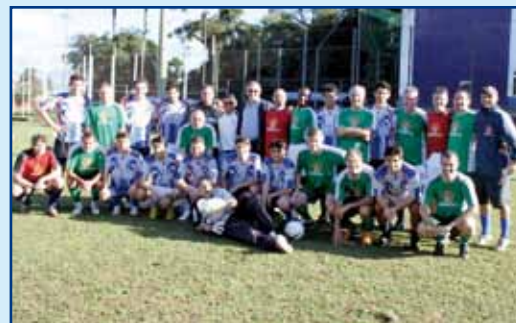
Candidatos a vagas nos times de soçaite master e livre.

As demais modalidades nas quais a APCEF-PR vai competir têm praticamente seus representantes definidos. O Paraná só não participará do revezamento 4x100 m do atletismo, do tênis de campo de duplas feminino e do futsal feminino. A delegação completa será composta por 101 integrantes, entre atletas, dirigentes e técnicos. Os treinos não param, em especial de futebol, vôlei e basquete.