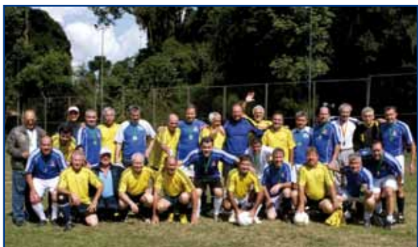
O campeão Matinhos (azul) com o vice, Aposentados 50.

Os cinquentões agora aguardam a segunda edição do Futsal Cinquentinha, previsto para o segundo semestre.