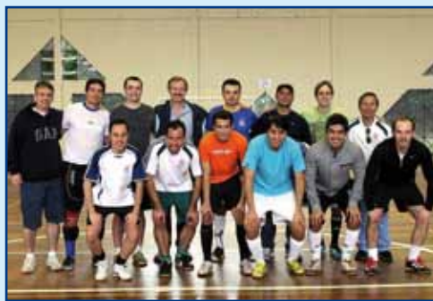
A “peneira” que ajudou a definir a equipe de futsal do PR.

A Coordenação de Esportes está correndo contra o tempo para organizar os detalhes e a delegação que seguirá para os Jogos da Fenaes, em Vitória (ES). No final