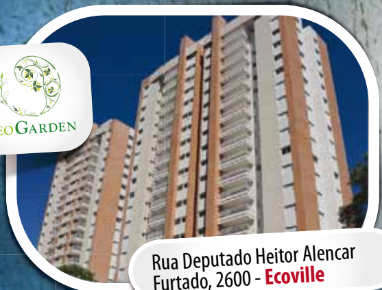
Rua Deputado Heitor Alencar Furtado, 2600 - Ecoville