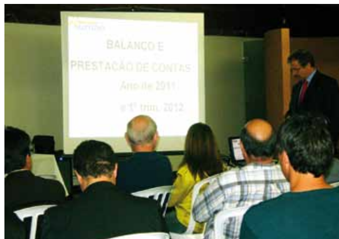
Apresentação das obras e atividades realizadas em um ano e três meses.

Para este ano, a proposta é a construção da sede em Alvorada do Sul, com área de 200 metros quadrados e início das obras em julho, ao custo previsto de R$ 200.000,00. O planejamento de 2012 ainda prevê a elaboração do projeto da nova sala de ginástica e academia da sede de Curitiba e a avaliação e manutenção das instalações desta sede e da de Caiobá.