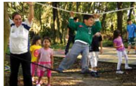
Diversão sob a supervisão de monitores.

Data: 9 a 20 de julho (de segunda a sexta-feira, das 13h30 às 17h30) Local: sede social da APCEF-PR Contato: (41) 3083-1001