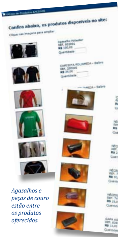
Agasalhos e peças de couro estão entre os produtos oferecidos.

Vitrine virtual exibe peças com a marca da entidade