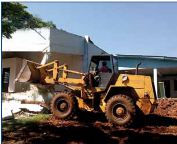
Início da obra em agosto de 2011: demolição da antiga sede.

As máquinas derrubaram as antigas instalações sede de Porto Rico no 25 de agosto do ano passado. De lá até junho deste ano, foram dez medições, etapas nas quais se avaliou o cumprimento do cronograma e a qualidade das obras.