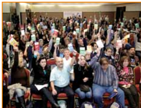
No Conecef, delegados aprovam itens da minuta.

A largada para a campanha salarial dos bancários ocorrerá somente no segundo semestre, mas os preparativos já começaram. No Paraná, o aquecimento iniciou com o Encontro Estadual dos Empregados da Caixa Econômica Federal, realizado no dia 2 junho, em Curitiba. Questões que afetam o dia-a-dia dos economiários do estado e seus anseios foram levados ao 28º Congresso Nacional dos Empregados da Caixa (Conecef), que ocorreu de 15 a 17 de junho, em Guarulhos (SP).