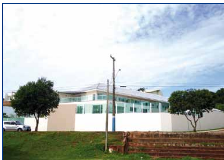
Fachada geral da nova sede pesqueira, que ocupa toda a esquina da quadra.

Em números, o investimento a que Willemann se refere é o valor de cerca de R$ 1,3 milhão, entre projeto, execução de obras, mobília e outros equipamentos. A quantia foi levantada por meio de contrapartida das mensalidades, por dois anos, de 150 novos sócios da região Noroeste, da Fena e da própria APCEF-PR. O resultado é uma bela sede que atenderá todos filiados, especialmente os do interior e, também, será opção para sócios de outras APCEFs que fazem fronteira com Porto Rico, como as de Mato Grosso e São Paulo.