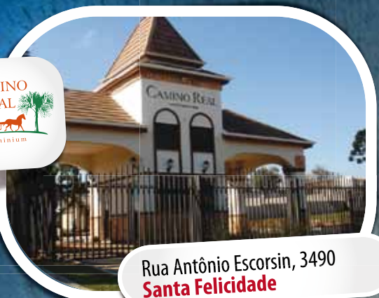
Rua Antônio Escorsin, 3490 Santa Felicidade