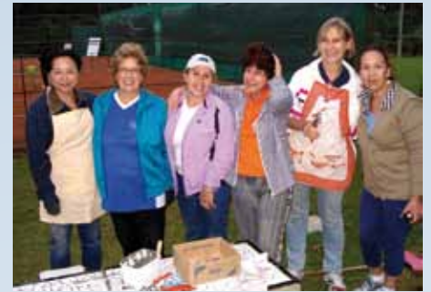
Autoras da arte em mosaico alusiva ao tênis.

Homenagem à APCEF-PR AEA-PR entrega banco decorado com arte em mosaico