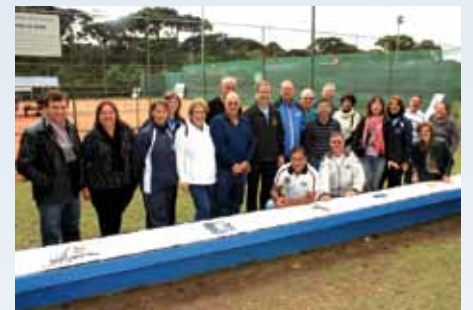
Inauguração do banco decorado, com dirigentes e associados.