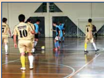
Partida da primeira rodada da competição.

O Campeonato de Futsal Livre abre as competições de futebol de salão da APCEF-PR este ano. Para fazer a bola rolar em quadra, 13 equipes se inscreveram e disputam a competição pelas chaves A e B. São elas: Choop Bol, Centauro, Terça 1, Elco, Apolo 10, Dá Pressão, UFC, Terça A, São Domingos, Centauro, Elco Jr., Insano, Dá Pressão/Locos da Inchente e Tenistas. A primeira rodada aconteceu em 16 de junho, com partidas iniciadas a partir das 9h15. Os jogos são realizados aos sábados.