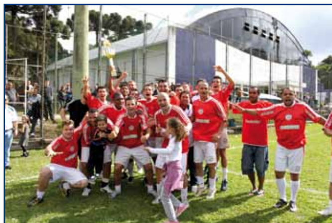
A festa dos jogadores do Choop Bol pela conquista do troféu.

19 de maio, o nome do campeão da série prata foi conhecido. O Sporting venceu o Fairplay por 4 a 2 e garantiu o título. O Campeonato de Futebol de Campo começou em 3 de março e reuniu 12 times.