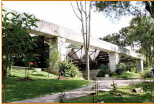
Sede de Curitiba: o início da trajetória da APCEF.