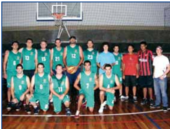
Equipe da APCEF-PR que participa do Campeonato Metropolitano.

Organização e treino são as palavras de ordem para o grupo de basquete da APCEF-PR, que busca melhor classificação nos Jogos da Fena e em outros campeonatos de Curitiba. Em média, 14 associados, entre empregados da Caixa e não funcionários, participam dos treinamentos, realizados às quartas-feiras (20h15 às 22h30) e aos sábados (16h às 18h30).