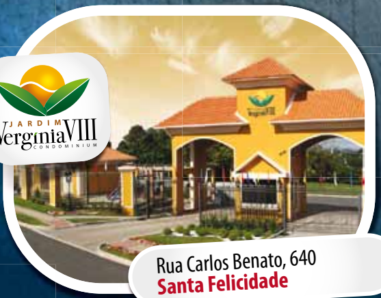
Rua Carlos Benato, 640 Santa Felicidade