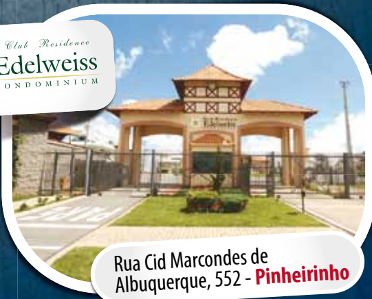
Rua Cid Marcondes de Albuquerque, 552 - Pinheirinho