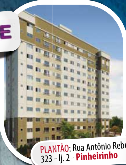
PLANTÃO: Rua Antônio Rebelato, 323 - lj. 2 - Pinheirinho