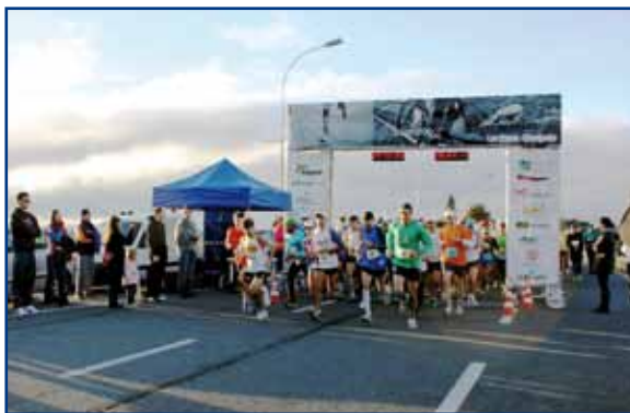
Largada da prova realizada no piso de embarque do aeroporto.

A Assessorcor também divulgou o resultado alterado dos 5 km, considerando quem completou a prova em 3,7 km, por equívoco no percurso. Os três primeiros colocados do pelotão nas duas distâncias (10 km e 3,7 km) receberam troféu. Todos os participantes da APCEF e da BPM ganharam medalha da prova do aeroporto e da Corrida do Pessoal da Caixa, patrocinada pela Fenaes.