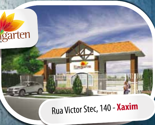
Rua Victor Stec, 140 - Xaxim