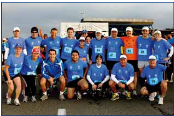
Parte do “time” da APCEF-PR que participou do pelotão especial.

Neste ano, prova aconteceu como pelotão especial de corrida no aeroporto