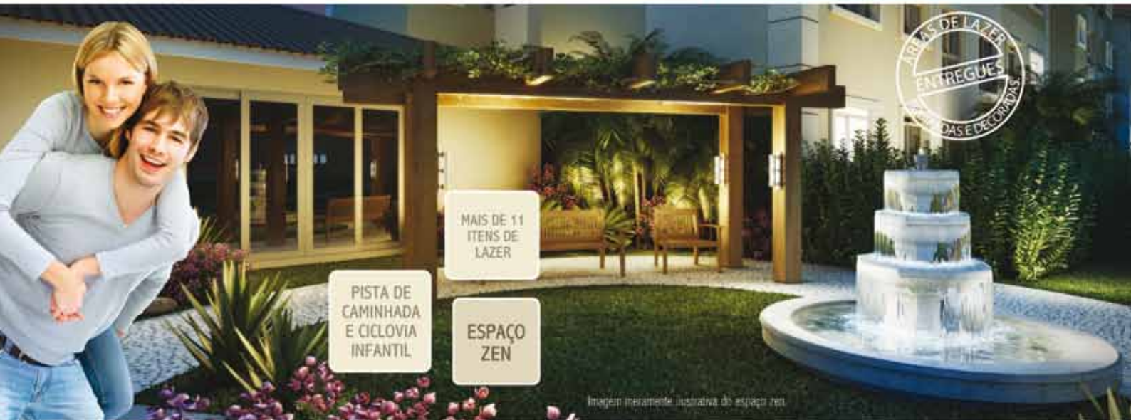
Imagem meramente ilustrativa do espaço zen.

TUDO QUE VOCÊ QUERIA E MAIS UM POUCO: FACILIDADE DE PAGAMENTO.