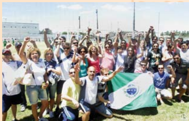
Parte da delegação paranaense durante os Jogos: vibração.

Durante uma semana de disputas, os 101 atletas paranaenses competiram em 24 das 25 modalidades dos Jogos. A maioria das premiações foi obtida nas provas individuais. As medalhas de ouro vieram na natação masculina, na corrida rústica masculina (5 km e 10 km - faixa 3), no salto em distância feminino, no tênis de mesa masculino e no tênis de campo simples feminino. Da modalidade coletiva, o time do futebol soçaite livre surpreendeu e garantiu o topo do pódio.