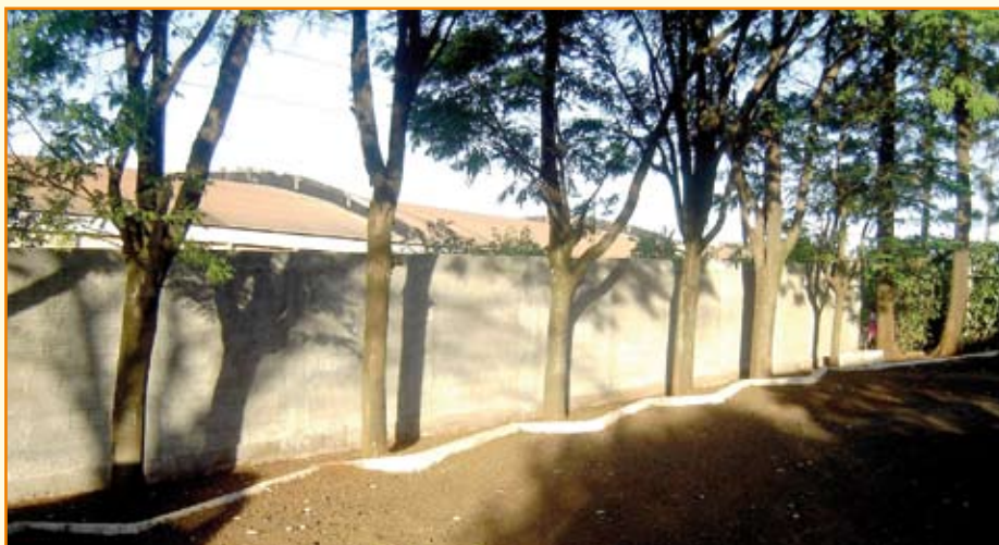
Muro construído circunda a sede, em substituição a delimitação de arame.

Regional ganha muro em toda sua extensão e novos equipamentos para o salão social