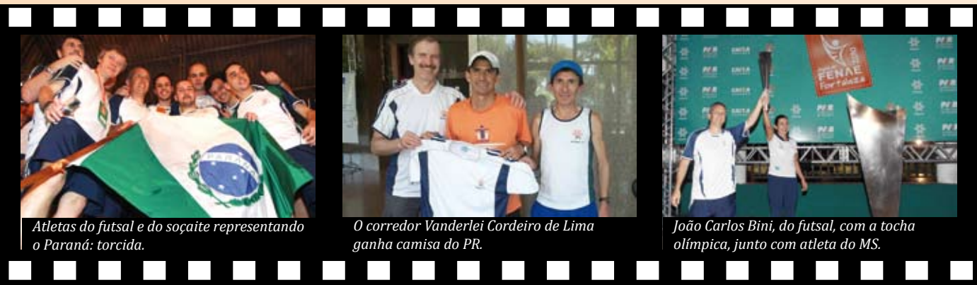
Atletas do futsal e do soçaite representando o Paraná: torcida.