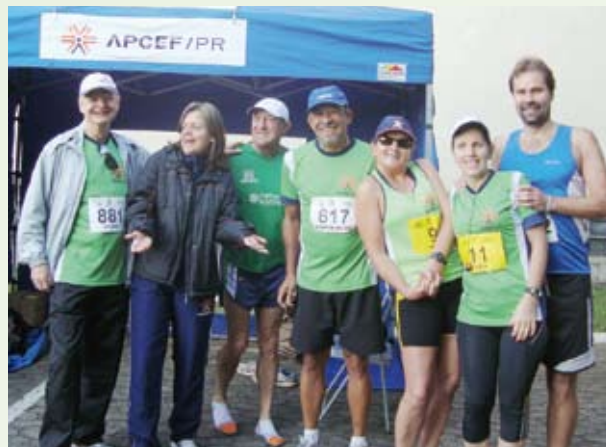
Corredores que participaram da 4ª etapa do Circuito da Prefeitura.

a corrida do Sesc e, para finalizar a programação, em 5 de dezembro, ocorrerá a corrida do Parque Tingui.