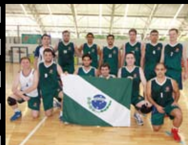
Jogadores de vôlei marcam pontos para o PR, assim como...