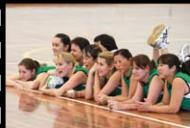
...as jogadoras, que mostram estar bem à vontade em quadra.