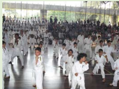
Exame reúne centenas de alunos de Curitiba e região.