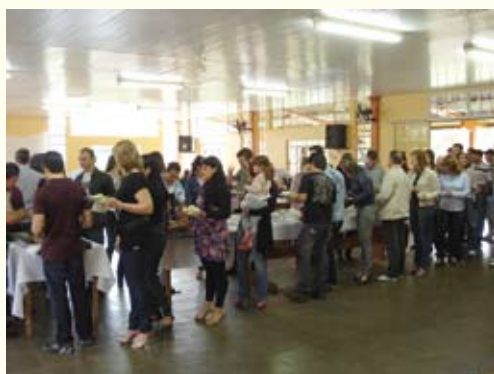
Almoço contemplou diversas unidades da Caixa do Oeste.