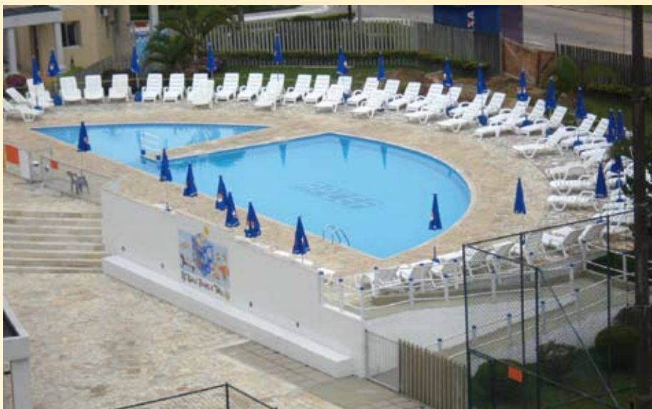
Deck pronto: mais espaço para usufruir da piscina e aproveitar o sol.