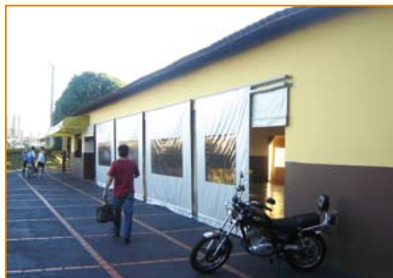
Salão Social com novo toldo: proteção contra a chuva e o vento.

Além do salão social, a sede de Bandeirantes conta com piscina, duas churrasqueiras, playground, sauna (no momento desativada), campo de futebol e quadra para jogar vôlei. Atualmente, o quadro associativo é formado por 50 filiados, mas a intenção é atrair novos sócios e ampliá-lo.