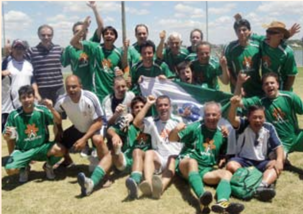
Jogadores do soçaite livre vibram com o título de campeão.

Os times de futebol soçaite livre e master da APCEF-PR deram um show de bola e gols nos Jogos da Fenaef. As duas equipes disputaram as finais, se empenharam até o último minuto de jogo e festejaram a conquista das medalhas de ouro e prata.