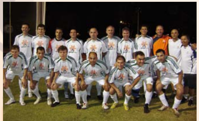
Equipe de soçaite master conquista medalha de prata em disputa acirrada.

Futsal também marca pontos – Apesar de não terem subido ao pódio, o time de futsal da APCEF-PR, que se classificou entre os primeiros em outras edições da competição, pontuou para a delegação do Paraná.