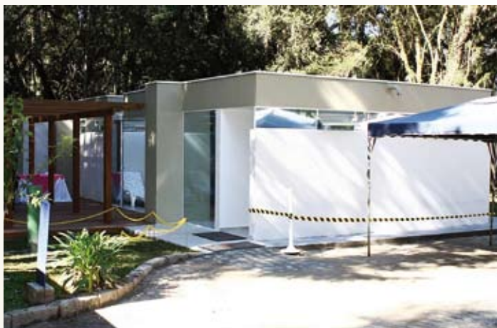
Espaço da Mulher: atividades dedicadas ao público feminino.

O novo espaço, onde funcionava há alguns anos o Clube do Bebê, foi totalmente reformulado. Com 80 m 2 , o novo ambiente abriga espaço para sauna úmida e seca, sala para descanso, áreas para banho, massagem e atividades, como manicure e pedicure. O deck com paisagismo completa o conjunto da obra. A empresa que oferecerá os serviços passou por uma criteriosa seleção e iniciará as atividades em breve.