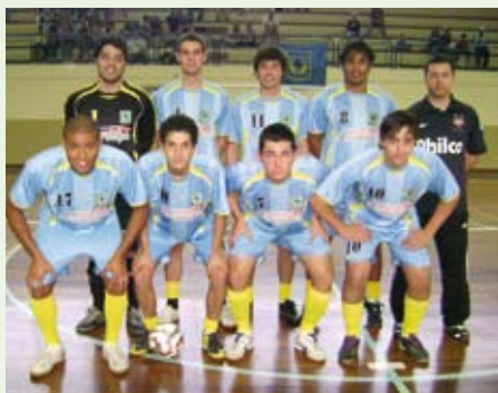
Time do Centauro A, campeão da série ouro.

Ao completar um ano de existência em setembro, o Centauro A ganhou um presente de aniversário no dia 11 desse mês: o segundo título do time no Campeonato de Futsal Livre da APCEF-PR. Na final da competição, realizada na Sede Social, a equipe venceu o Choop Bol por 5 a 1 e soltou o grito de campeã, pela série ouro. Já o Centauro B ficou com a segunda colocação da série prata, após a vitória do time Dínamo Azul, por 10 a 6.