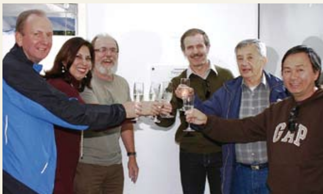
Diretores brindam a inauguração da obra.