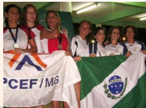
Nadadoras do revezamento: terceiro lugar no pódio.