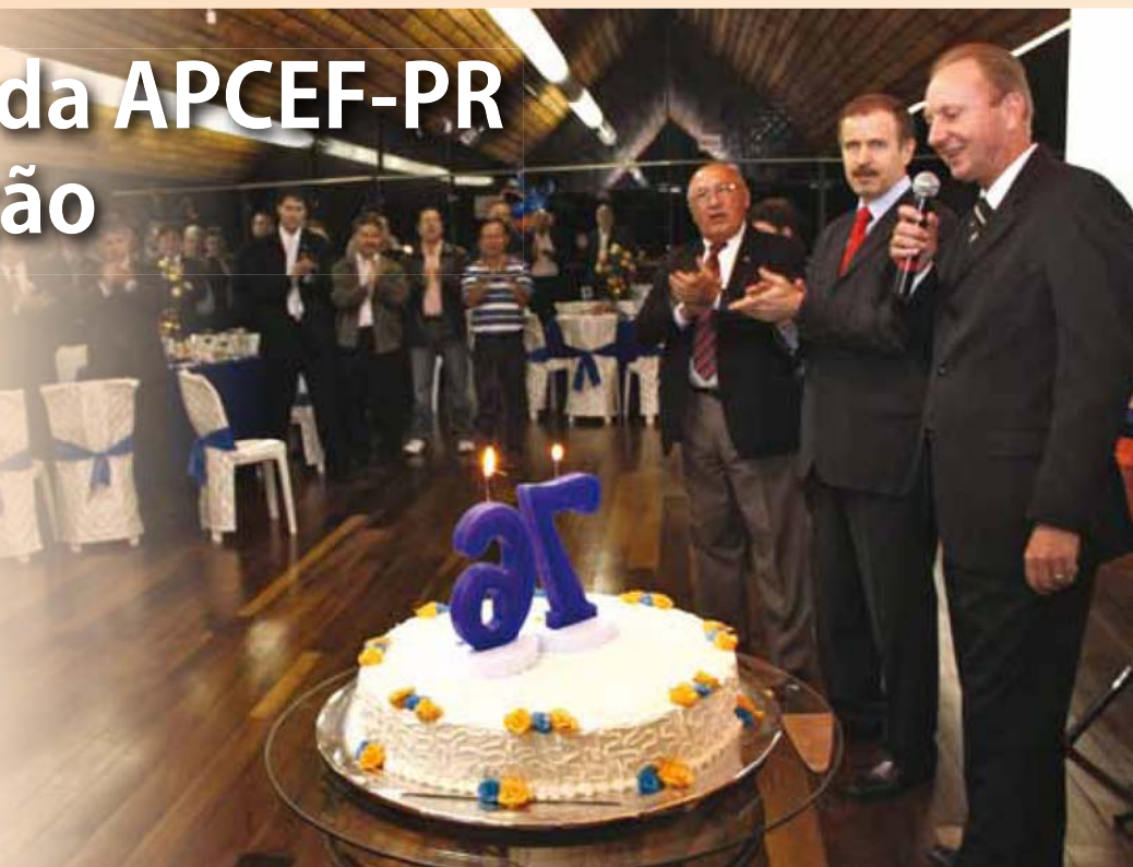
Diretores, representantes de entidades e associados celebram o aniversário da associação.

Para a condução da assembleia, a presidente do Conselho Deliberativo,