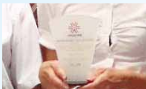
Troféu 100%: em abril, mais duas unidades do interior receberam a premiação.

Troféu "Equipe 100% APCEF-PR" e Jantar do Dia das Mães