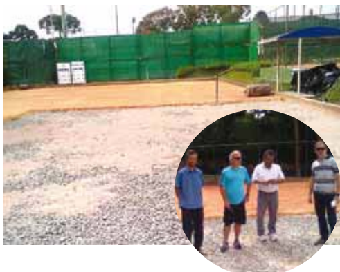
Quadra de tênis em obras e, no detalhe, inspeção “in loco” de gestores.

Para propiciar um espaço ainda mais adequado para os tenistas, a APCEF-PR investiu na reforma geral das quadras de tênis número 1 e 2 da Sede Social. As obras, inspecionadas periodicamente por gestores da associação, foram concluídas recentemente. Nas fotos, as quadras ainda passavam por benfeitorias. Entre elas, remoção, colocação, compactação de saibro, colocação de linhas demarcatórias e recolocação de rede. Além desses incrementos, a quadra número 1 também recebeu melhorias. “Essa é mais uma ação para tornar a APCEF-PR cada vez melhor, agora, atuando nas condições das quadras de tênis para atender, com excelência, os adeptos desse esporte”, afirmou o presidente da associação, Wilson Willemann.