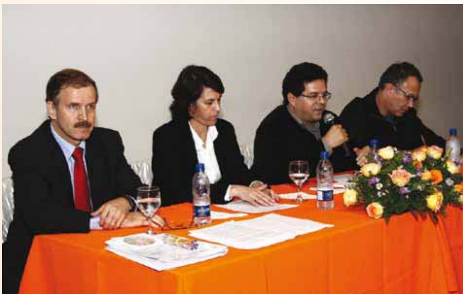
Mesa diretiva da assembleia: ao microfone, o presidente do Conselho Fiscal: contas da APCEF-PR estão em dia.