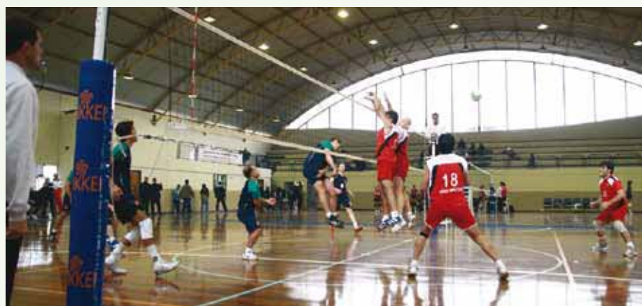
Partida de vôlei masculino nos Jogos de 2009, quando a equipe do Paraná foi vice-campeã.