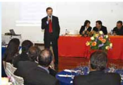
Apresentação de prestação de contas de 2010 inicia festa de aniversário.

APCEF-PR festeja seus 76 anos com programação diferenciada