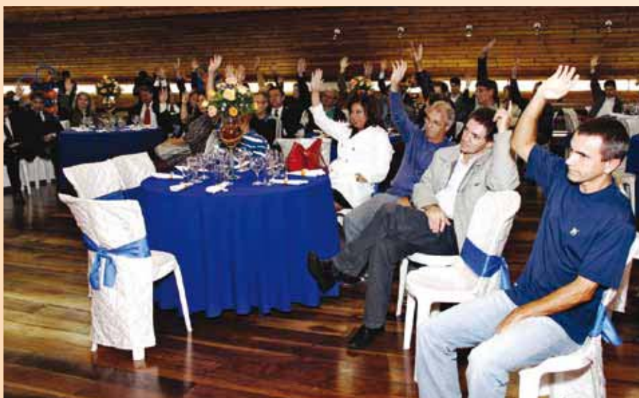
Associados aprovam a prestação de contas e o balanço patrimonial 2010.