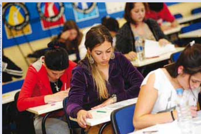
Vestibular agendado do Dom Bosco, no ano passado: respeito à pluralidade.

Faculdades conveniadas à APCEF-PR iniciam inscrições e oferecem também o exame agendado e benefícios aos associados