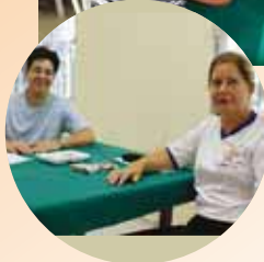
Partidas da 4ª etapa do Torneio de Tranca. No detalhe, dupla que disputará os Jogos do Sul e Sudeste.