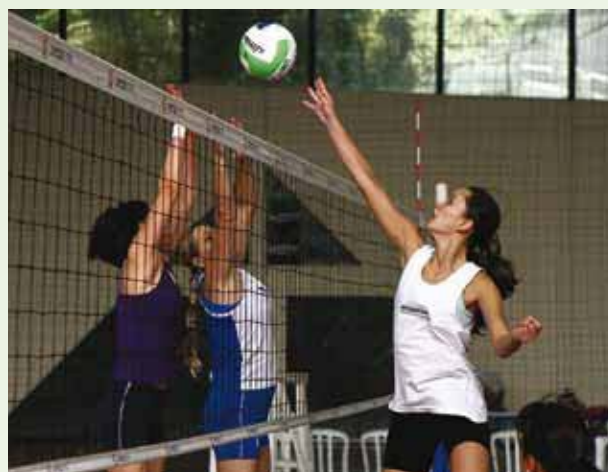
Jogadoras de vôlei treinam intensivamente para a competição.

Durante cinco dias, os Jogos do Sul e Sudeste reunirão competidores das associações da Caixa do Paraná, Rio Grande do Sul, Santa Catarina, São Paulo, Rio de Janeiro, Minas Gerais e Espírito Santo. Os atletas vão disputar mais de 20 modalidades, entre individuais, de duplas e coletivas. Assim como na estreia da competição em 2009, na cidade de Curitiba, não haverá classificação geral das APCEFs participantes. Os três primeiros colocados em cada modalidade receberão premiação.