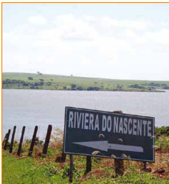
Acesso ao Condomínio Riviera do Nascente, em Alvorada, onde funcionará o espaço da APCEF-PR.