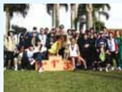
Participantes da Corrida do Pessoal da Caixa, em 2010: este ano prova será antecipada.

Ginástica, atletas do PR na Volta à Ilha e Corrida do Pessoal da Caixa