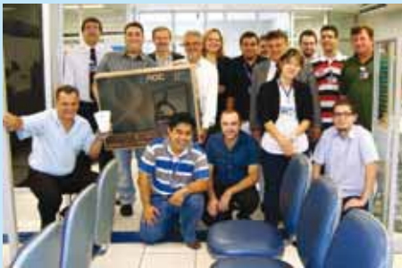
Comemoração dupla: entrega do troféu na agência Porecatu e de TV da campanha "Mais 500".

PAB de Londrina e agência de Porecatu recebem premiação, após completarem quadro funcional de associados