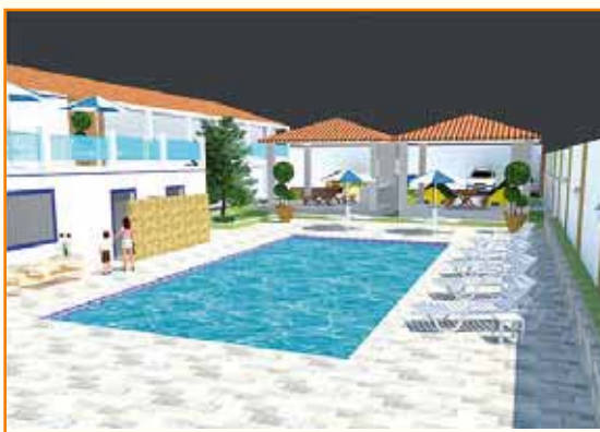
Perspectiva da Sede Pesqueira: projeto está saindo do papel.